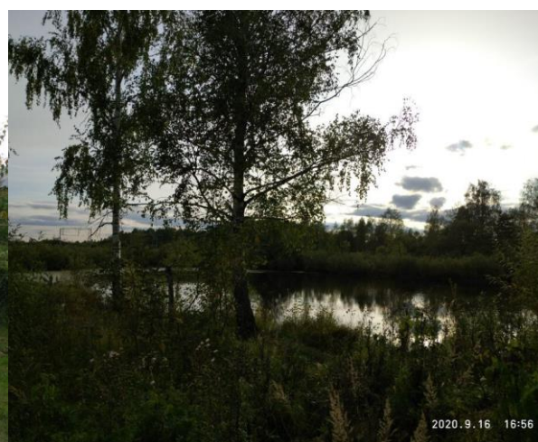
Пруд на улице Сосновой