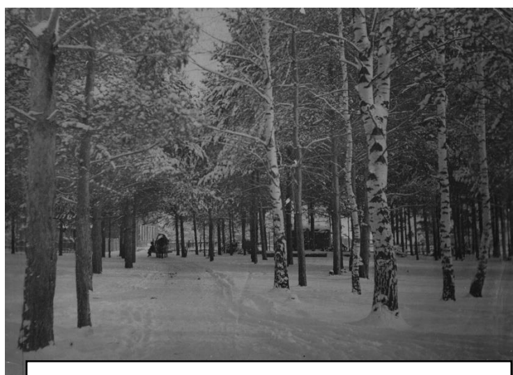
Фото 1950 года. Дорога через сосновый бор в лабораторию ВОП