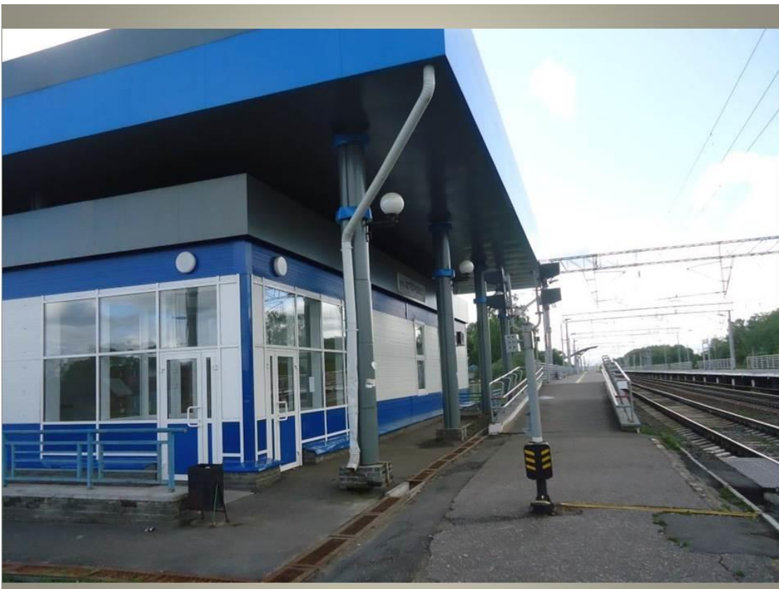
Фото 2. Железнодорожный вокзал с 2011 г.