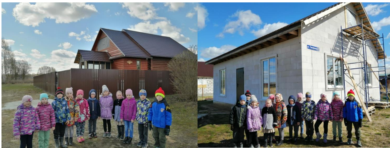
Новые дома молодых семей на улице Тимофеева в селе Второво