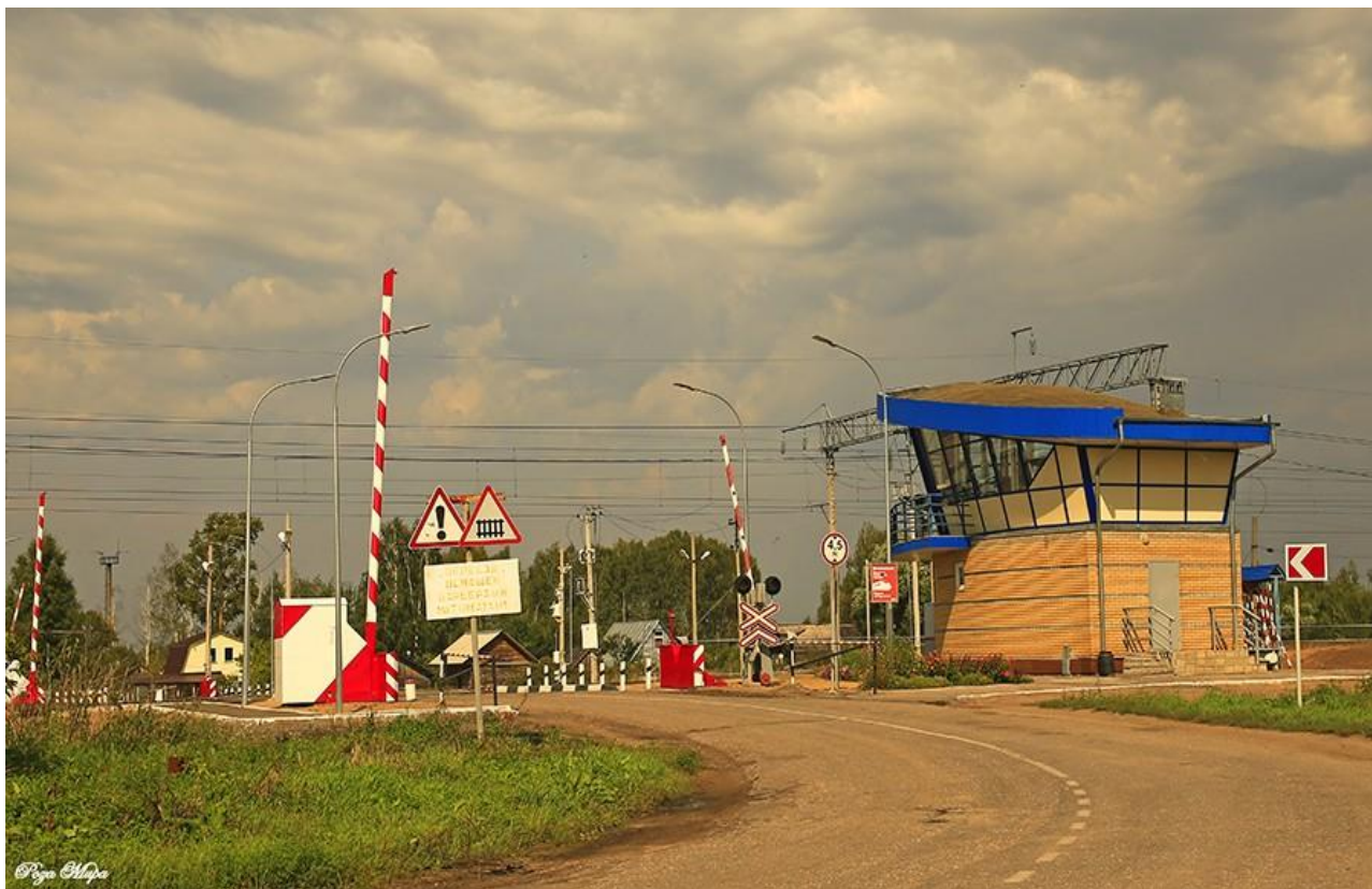
Фото 5. Железнодорожный переезд на улице Железнодорожной