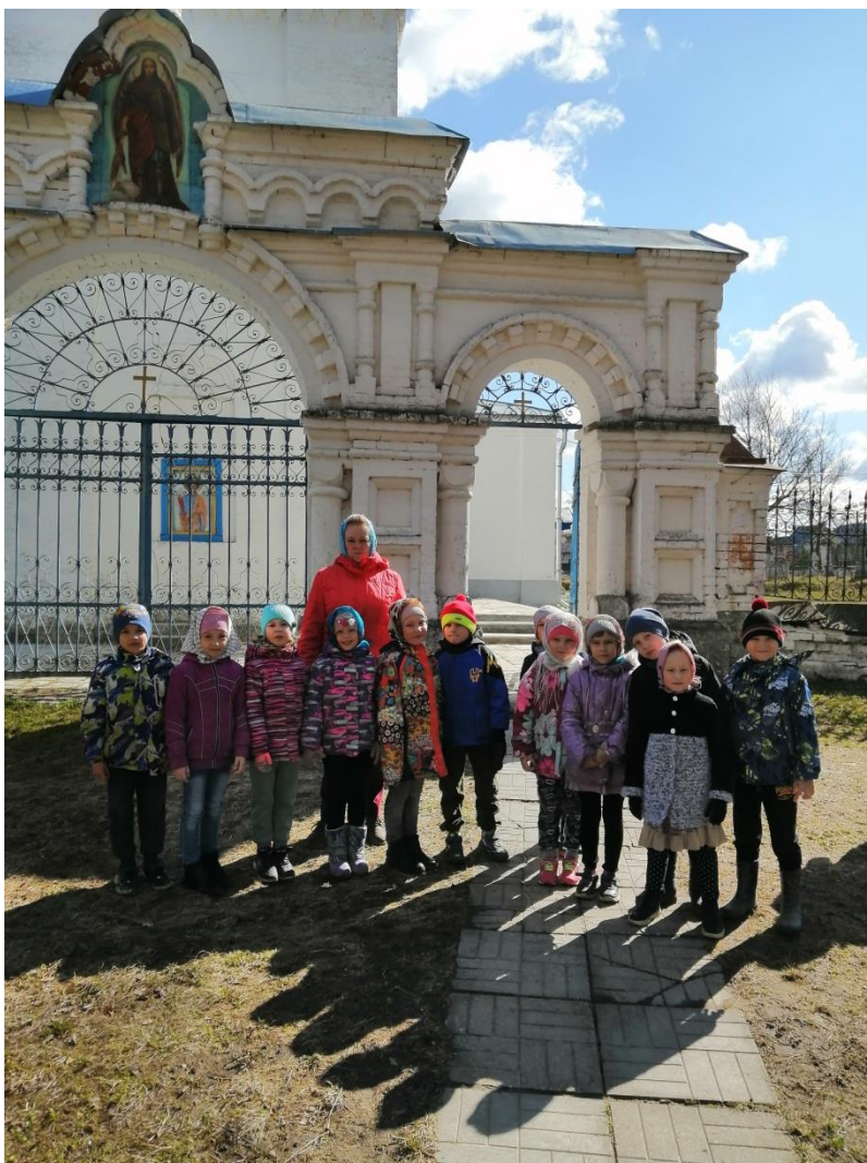
Церковь Михаила Архангела на улице Спортивной в селе Второво

годов двадцатого века футбольное поле было действующим. На нем проходили соревнования между футбольными командами нашего села и других сел района. Команды были детские и взрослые. Когда соревнований не было, тогда на поле проходили тренировки. В конце семидесятых годов двадцатого века футбольное поле переместилось на территорию школы. Сейчас на территории бывшего футбольного поля строятся личные дома молодыми семьями.