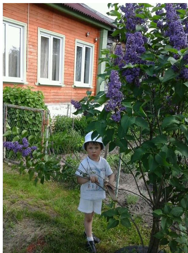
Современная улица Сосновая