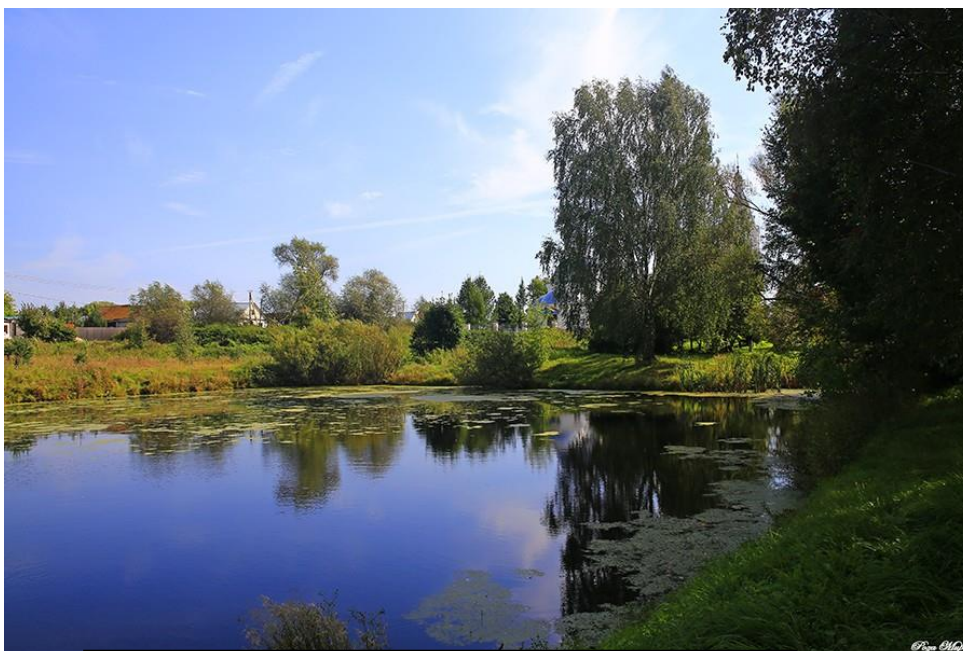
Второй пруд на улице Спортивной