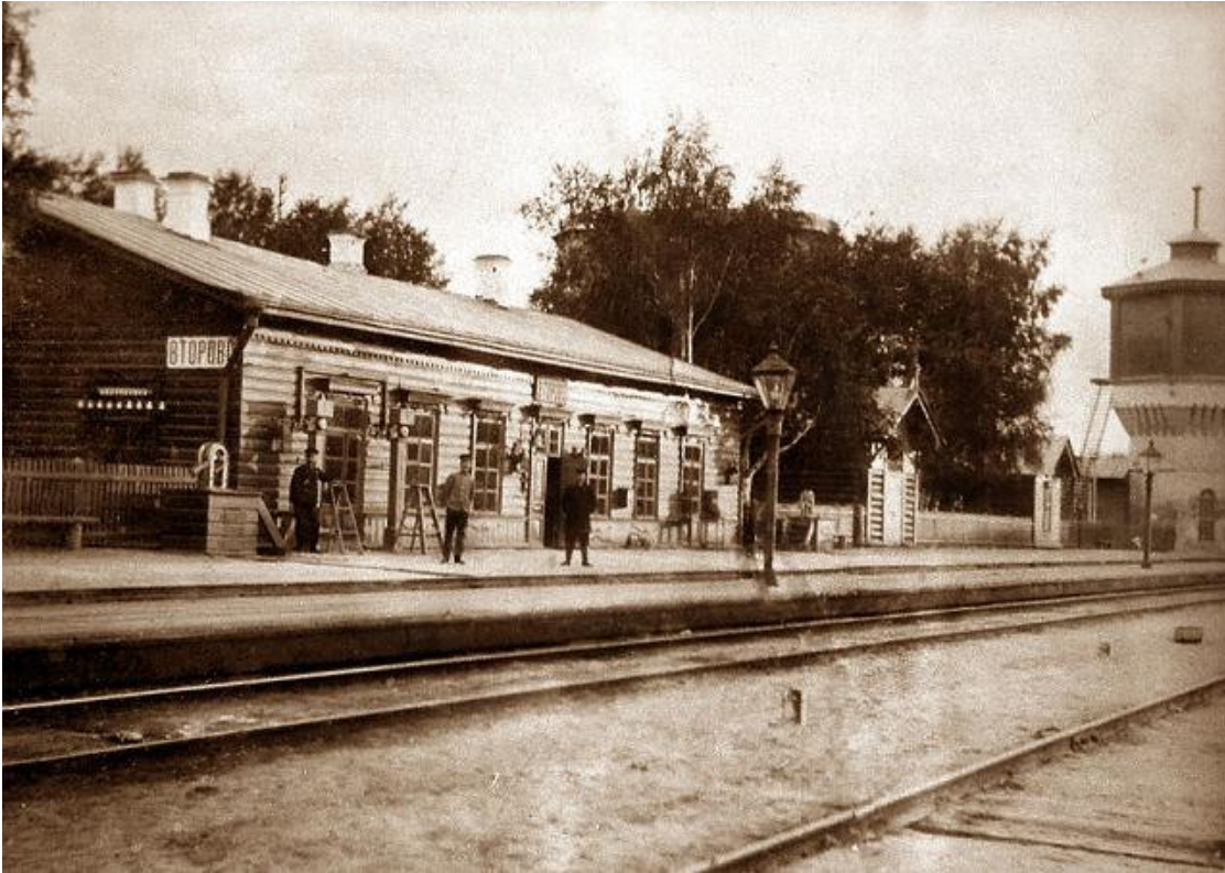
Фото 1. Железнодорожный вокзал (1879-2011 г.)