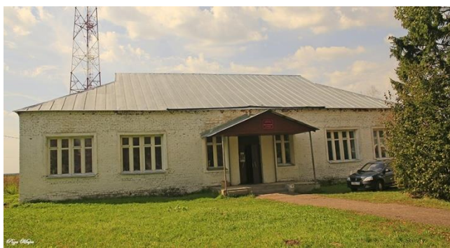
Дом Культуры в селе Второво