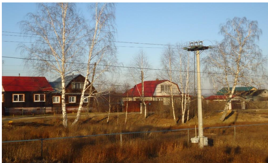
Фото 4. Дома на улице Железнодорожной в 2021 г.