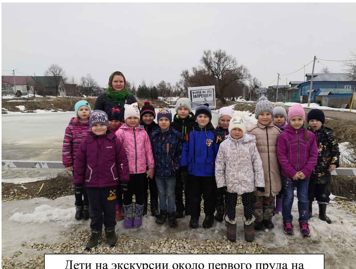
Дети на экскурсии около первого пруда на улице Спортивной