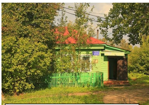
Библиотека в селе Второво