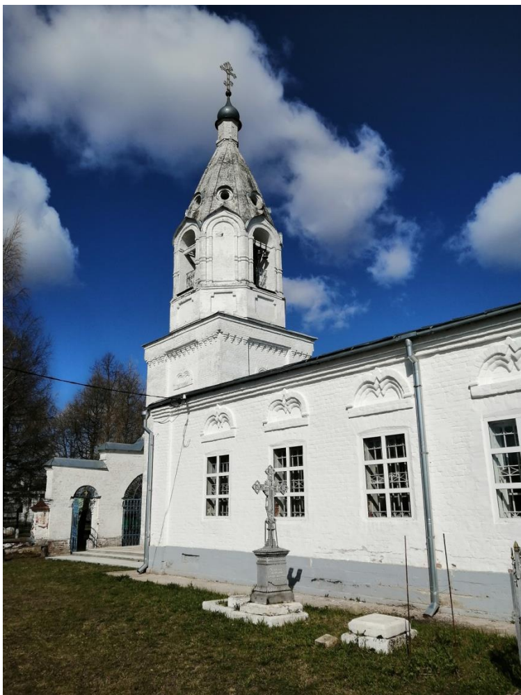
Колокольня церкви Михаила Архангела