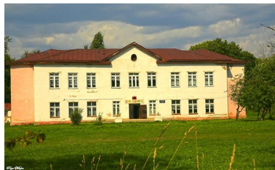
Школа в селе Второво