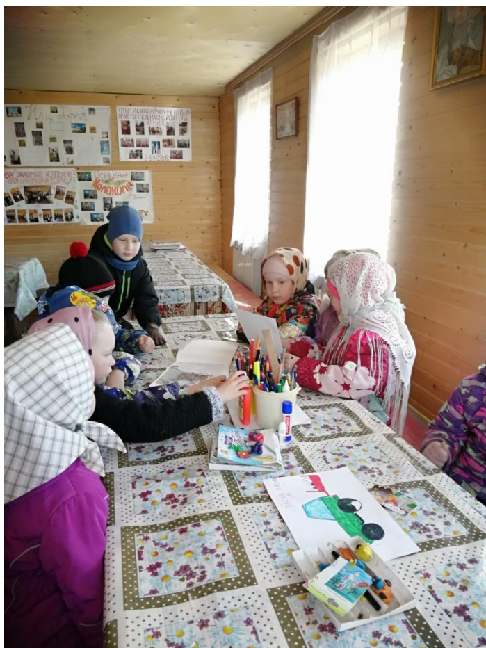
В здании воскресной школы при церкви Михаила Архангела